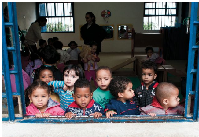
Op school leren kinderen samen te spelen ongeacht hun afkomst of achtergrond.

Soms krijgen we hier de indruk dat Zuid Amerika een tropische westerse cultuur heeft, maar de laatste dagen merken we ook grote verschillen onder andere na de moord van een zwarte man door twee blanke bewakers van een winkel van Carrefour. Discriminatie kan soms al vroeg beginnen. Op school maken we geen onderscheid tussen blank en zwart, maar de problemen beginnen vaak van huis uit.