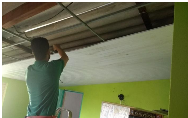
Er moesten 40 nieuwe golfplaten opgelegd worden