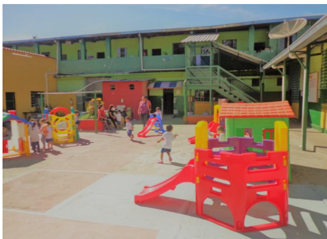
Speelplaats met 6 grote plastic speeltoestellen. Op de achtergrond zijn klaslokalen van de crèche.