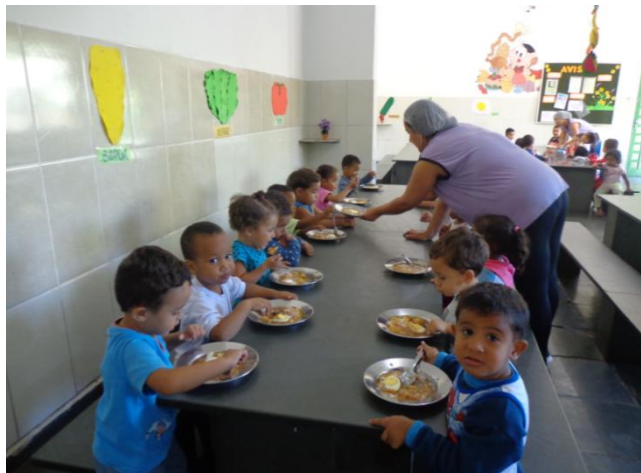
Nieuwe voorzieningen in de eetzaal waar kinderen eten krijgen. Alles te samen zijn er meer dan 200. De kleinsten (4 tot 12 mnd) blijven in de eigen zaal.