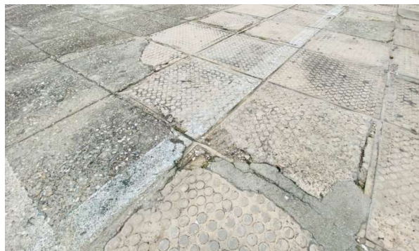
Zicht op de beschadigde bestrating van het schoolplein