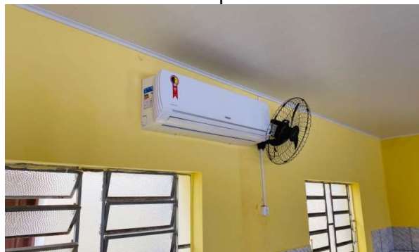
Één van de nieuwe airconditioners