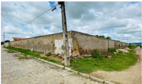
De buitenmuur van de school